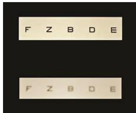
Gambar 2. Binocular Balancing Test

Menyeimbangkan akomodasi antara kedua mata atau dikenal dengan sebutan binocular balancing adalah langkah penting dalam refraksi. Tujuan binocular balancing bukanlah mencari ketajaman penglihatan yang sama antara kedua mata, melainkan lebih kearah menyeimbangkan usaha akomodasi keduanya. Pemeriksaan ini hanya dapat dilakukan bila ketajaman penglihatan dengan koreksi penuh terhadap gangguan refraksi telah didapatkan. Perbandingan antara ketajaman dari kedua mata menjadi dasar dari pemeriksaan ini. Penyeimbangan akomodasi akan mencegah osilasi akomodasi dan memberikan kontrol terhadap pemeriksaan refraktif monokular. Penelitian dari Rabbetts dkk menyatakan bahwa koreksi yang tidakimbang dapat menyebabkan asthenopia akibat pergantian dalam mencari fokus gambar antara kedua mata. Boris dan Benjamin dalam penelitiannya juga menemukan bahwa akomodasi yang tidakimbang dapat menyebabkan penurunan stereopsis dan menurunnya jangkauan konvergensi fusi.