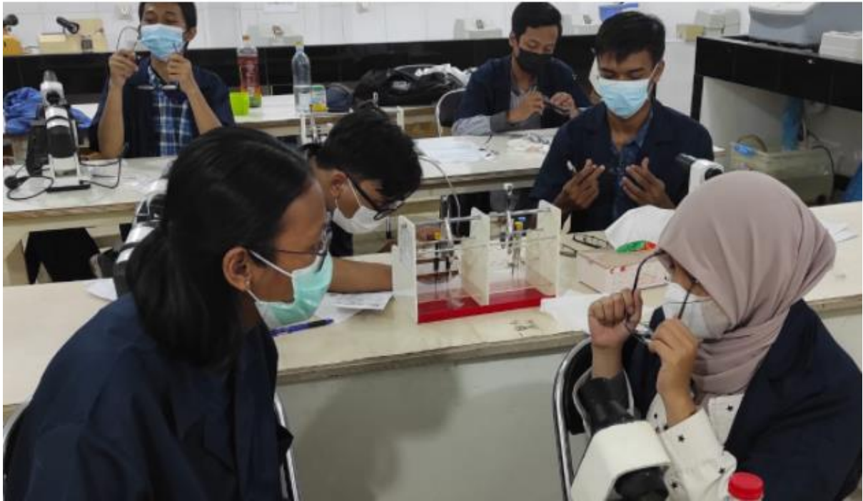
Rutinitas kegiatan Pembelajaran / Penelitian Mata di kelas ARO GAPOPIN