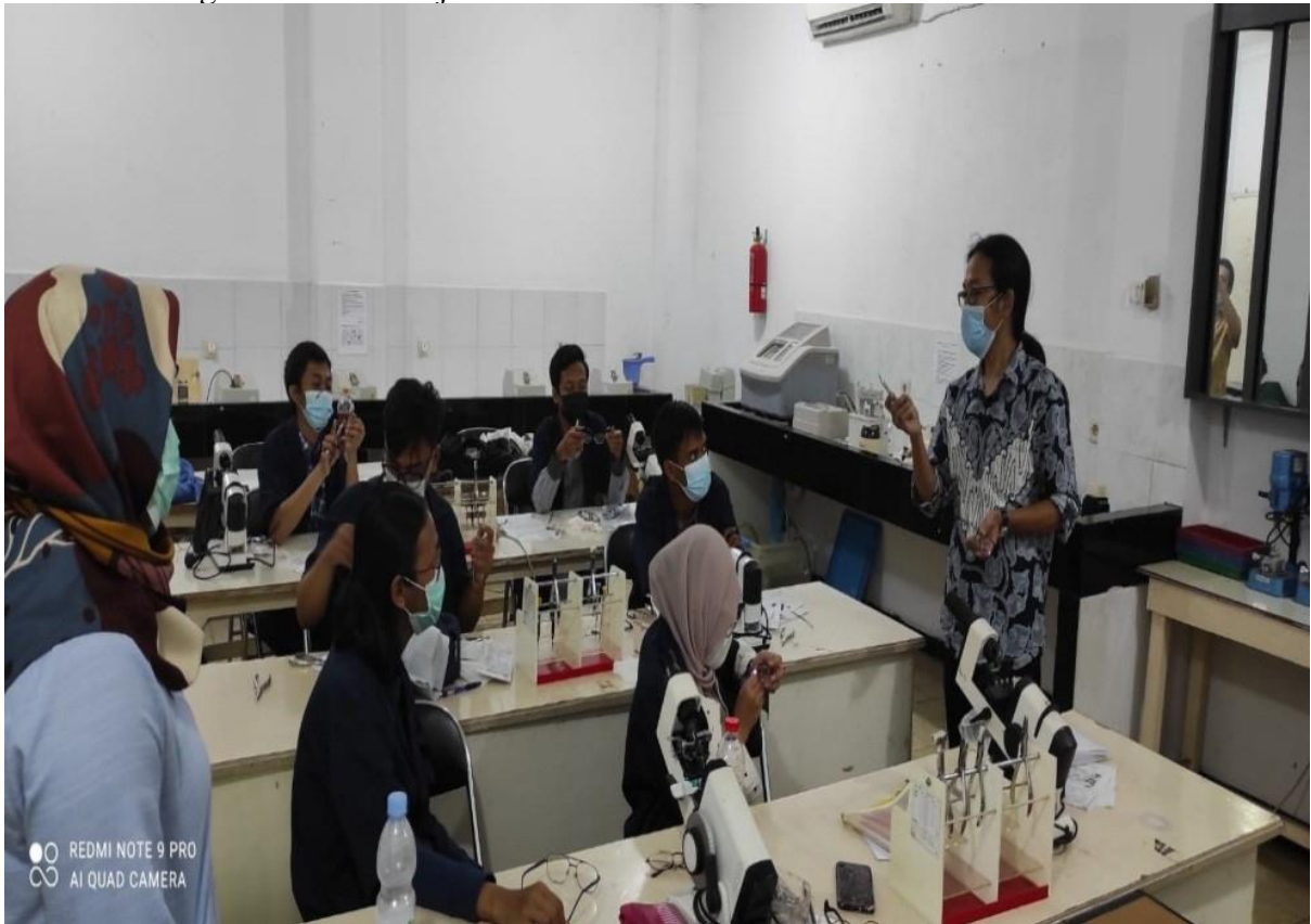
Rutinitas kegiatan Pembelajaran / Penelitian Mata di kelas ARO GAPOPIN